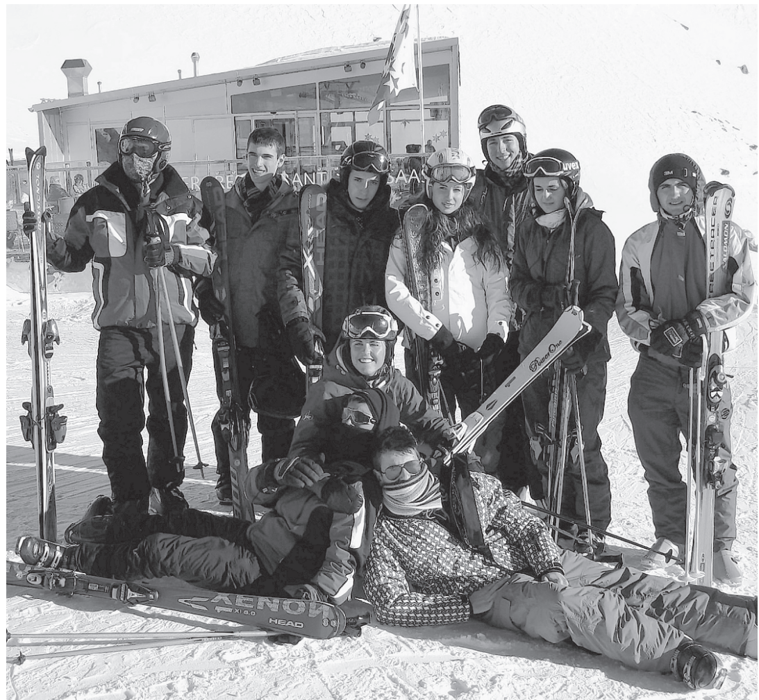
Stellvertretend für die 36 Lernenden: Eine Gruppe im Wintersportlager in Saas Grund.