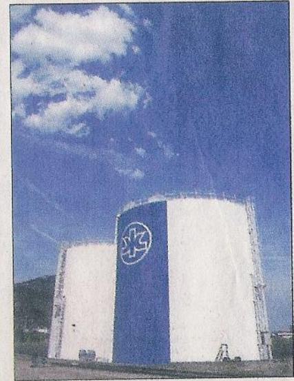
NIEDERBIPP Kimberly-Clark. URS LINDT

Bis anhin galten die Berufslernverbunde insofern als unverzichtbar, als sie die Ausbildung von Fachkräften auch für Betriebe ermöglichten, welche aufgrund ihrer Grösse oder ihrer Strukturen nicht in der Lage waren, diese Ausbildung alleine anzubieten. Das Beispiel der Papierfabriken im Raum Balsthal zeigt aber, dass auch in